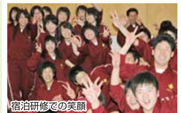
宿泊研修での笑顔