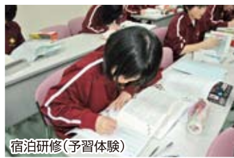
宿泊研修(予習体験)