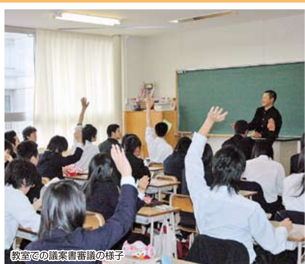
教室での議案書審議の様子

私は年生の三学期に同じクラスの友達四人で自治会執行部に入部しました。当初、何も分からずに行っていた執行部も最近では板に付いてきました。執行部に入ってからすぐに自治会のスローガンについて話し合い、全校生の皆さんにも議案書審議によって話し合いをもってもらいました。今年度から新しく議案書審議という皆さんに興議館について考えてもらう場を設けることができ大変嬉しく思います。全校生の皆さんの様々な意見・要望等により、現在、執行部はもちろんのこと、各委員会も興議館をより良い学校にしようと励んでいます。興議館の新しい歴史への二歩を生徒自治会、つまり全校生で築き上げていきます。