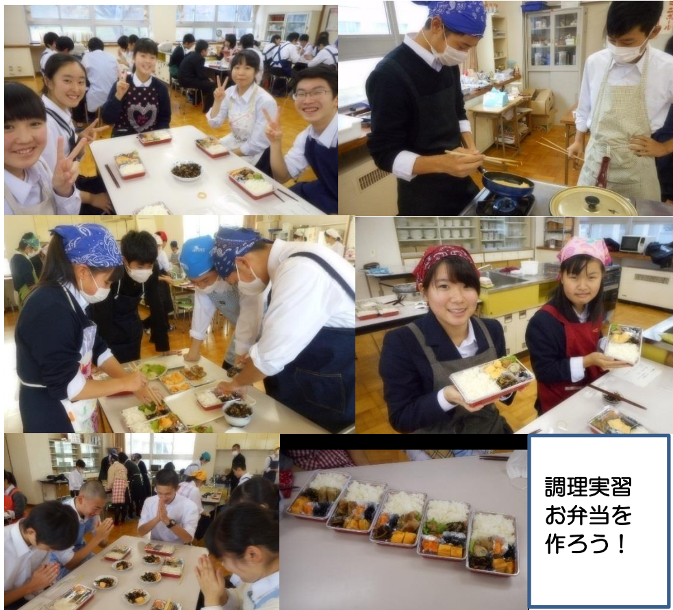
調理実習 お弁当を 作ろう！