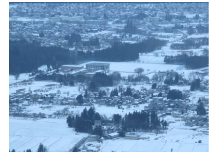
↑ぜひ、米興HPで閲覧下さい。

あけましておめでとうございます。昨年中は毎日懇切丁寧にご指導いただき、ありがとうございました。(中略)初日の出を拝むべく、笹野山に登ってきました。奥羽山脈が雲に覆われ、初日の出は望めないと思いきや、雲間から一筋に光が差し込みました。これこそが我々に差しこんできた希望の光なのだと思います。29日から30日にかけて降った雪で、足あと1つない雪道を踏みしめながら、いろいろなことを考えました。(中略)米興生が目標をつかみとることができるよう、願いを込めて、笹野山から望む一筋の光、そして米興の画像をお送りいたします。