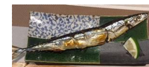
M家のサンマ。おいしそう

日本の秋の味覚、秋刀魚、食べましたか？私は5回くらいいただきました。目が澄んだ新鮮なものなら内臓まで食べてみてください！クセになる美味しさです。骨も食べられます。秋にしか食べることができない特別感もあるから余計愛着がわくのかもしれません。