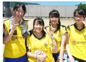
体育祭クラスメートと共に