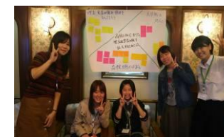
全国で20名に米興2年から3名！

また、イベントの中にグループ討議というものがあって、1班5人で、班に1人サイエンスエンジェルという女子大学院生さんがついてくれました。そのサイエンスエンジェルの方も優しく、様々な質問に答えてくださいました。そんな素敵な出会いがあり、2日間とても楽しく過ごすことができました。