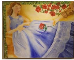
SNさんの地区美展作品「咲」

趣味は前回書いたので、今回は6中のことについて書こうと思います。6中は生徒数がとんでもなく少ないです。私たちのときは、ひと学年で45人でした…。ですが、その分1人ひとりの友情は男女関係なく深い気がします。とても楽しかった思い出でいっぱいです。私は6中が大好きです。