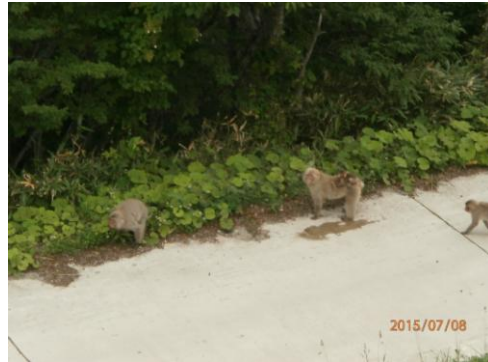
湯元駅で「さるがいた！」