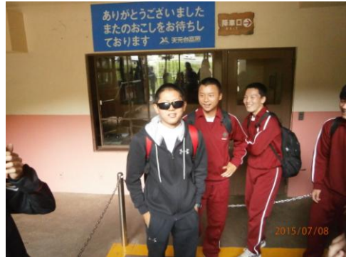
1日目 1～3組登山 湯元駅でロープウェイ待ち