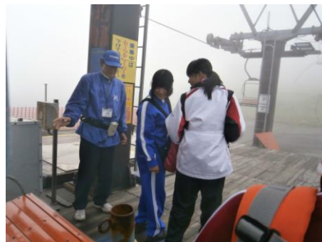
リフトの上から高山植物がよく見えました。木々も間近で葉の形が観察できました。3組 M

改めて米沢は大きな山々に囲まれて自然が豊かだと思いました。山から見る興譲館がミニチュアのように見えました。1組 R