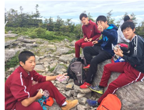
足元が悪い中の登山でしたが、頂上で見えた雲海は感動しました。4組 N