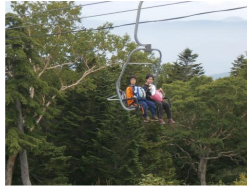
リフトから猪苗代湖、桧原湖が見えてきれいでした。1組 M

吾妻では多くの高山植物が適した環境下で生育していることが分かりました。校章の由来ゴゼンタチバナは葉が4枚と6枚のものがあり、6枚のものに花が咲いていました。2組 H