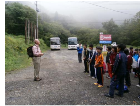
2日目 5・6組登山 岸校長先生にも同行していただきました。